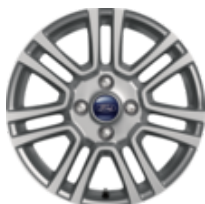
Könnnyűfém keréktárcsa 40,64 cm (16") 7 x 2 küllős kivitel, ezüst 6,5 x 16", ET40 195/55R16 abroncsokhoz