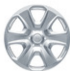
Dísz tárcsa 15" Egy darab