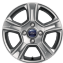
Könnnyűfém keréktárcsa 38,10 cm (15") 5 küllős kivitel, ezüst 6 x 15", ET 37,5, 195/60 R15 gumiabroncsokhoz